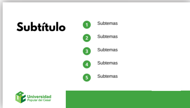
Subtítulos de interés